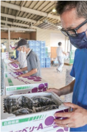
▲出荷検査をする部会メンバー

JAひろしま三次地域本部の三次市ぶどう部会は8月28日、三次産ニューベリーAの出荷をスタートしました。部会メンバーは、早朝に収穫したブドウを選果し、2kg箱に詰め、検査後に市場へ約270ケースを出荷しました。今年も着色、糖度、食味とも順調な仕上がりととなりました。